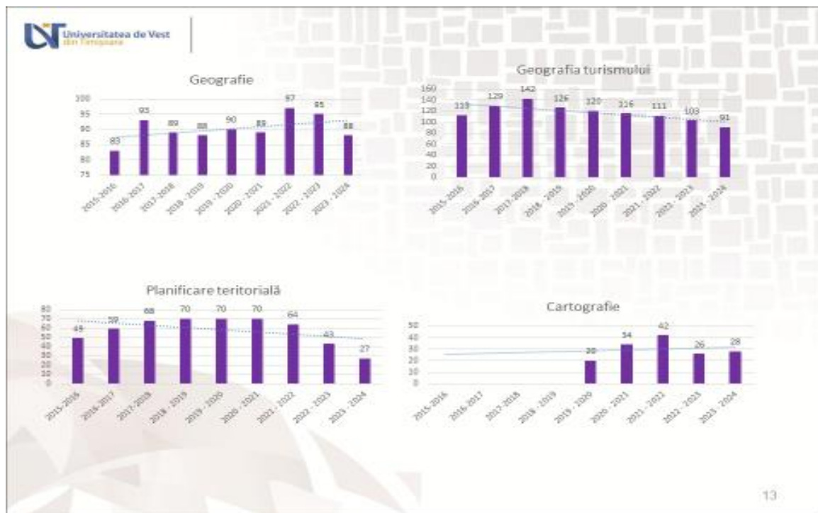
Reprezentarea grafică a evoluției numărului de studenți pe programe de studii